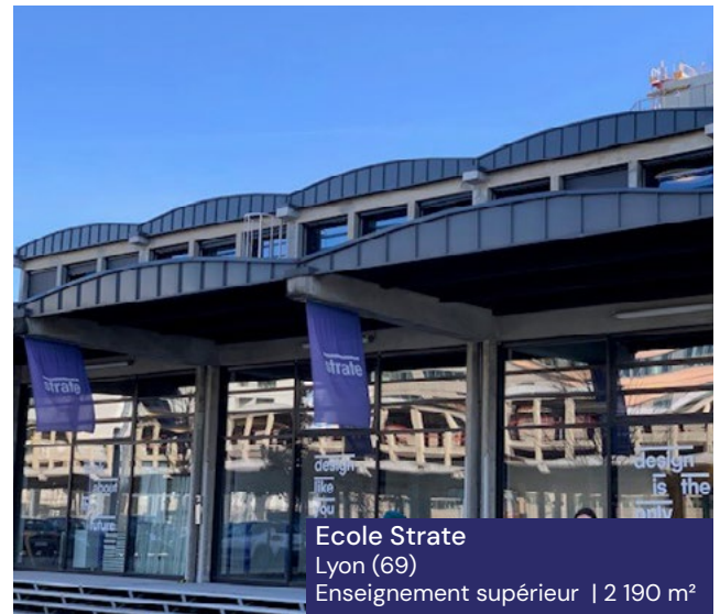
Ecole Strate Lyon (69) Enseignement supérieur | 2 190 m 2

Avec une plateforme européenne de professionnels de l'immobilier , permettant une sélection fine immeubles et des locataires, la SCPI vise à se constituer un patrimoine composé de bureaux, de commerces et de locaux d'activités ou d'entrepôts, mais également de typologies innovantes telles que la santé, l'hôtellerie ou encore le résidentiel géré (étudiant, senior, coliving) en France et dans des Etats qui ont été membres ou qui sont membres de l'Union Européenne.