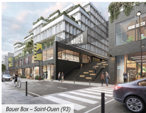
Bauer Box – Saint-Ouen (93)