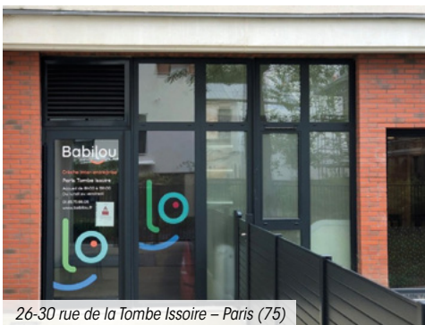
26-30 rue de la Tombe Issoire – Paris (75)