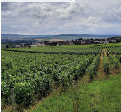
Lieudit Les Tahus - Hautvillers (51)

(2) Disponibles dans le prochain bulletin trimestriel suite à l'arrêté comptable du 31/12.