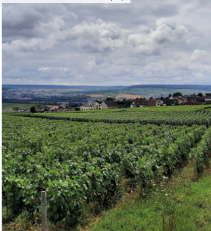
Lieudit Les Tahus - Hautvillers (51)

(3) Pour les non résidents, seuls les immeubles détenus en France sont pris en compte.